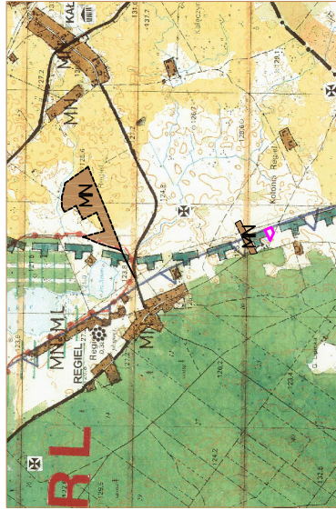
GRANICE TERENU OBJĘTEGO ZMIANĄ MIEJSCOWEGO PLANU ZAGOSPODAROWANIA PRZESTRZENNEGO

WYRYS ZE STUDIUM UWARUNKOWAŃ I KIERUNKÓW ZAGOSPODAROWANIA PRZESTRZENNEGO GMINY ELK