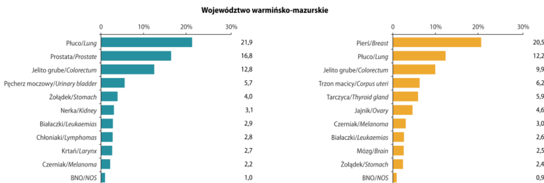
Rycina 4. Struktura zachorowań na nowotwory złośliwe w Polsce w 2018 roku

Województwo warmińsko-mazurskie należy do 3 obszarów, gdzie najczęstszym nowotworem mężczyzn jest nie rak prostaty, a nowotwór płuc, stanowiący około 20% udziałów w zachorowaniach nowotworowych. Dane dla K (żółty) i M (niebieski) wskazane na ryc. 4.