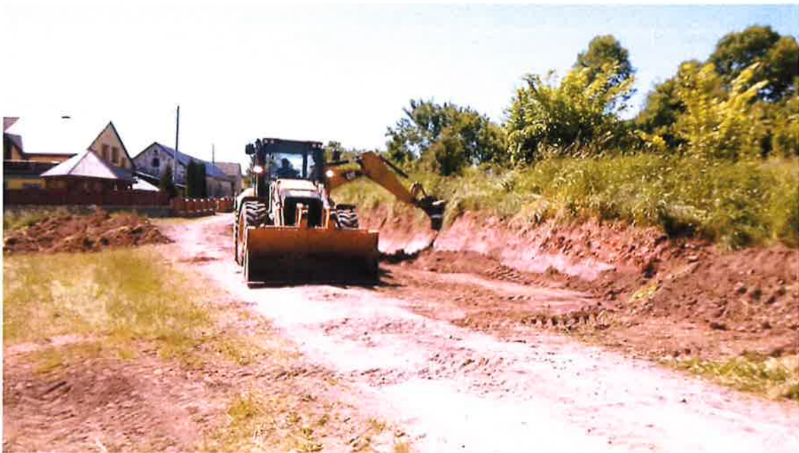
droga Ruska Wieś,