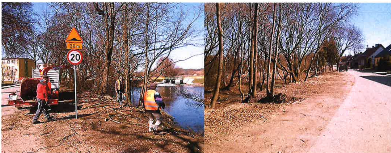
Wycinka krzaków w miejscowości Straduny.

Tuż przed przyjściem kalendarzowej wiosny Zakład Usług Gminnych Gmina Ełk Sp. z o.o. rozpoczął prace remontowe i pielęgnacyjne na terenie Gminy Ełk.