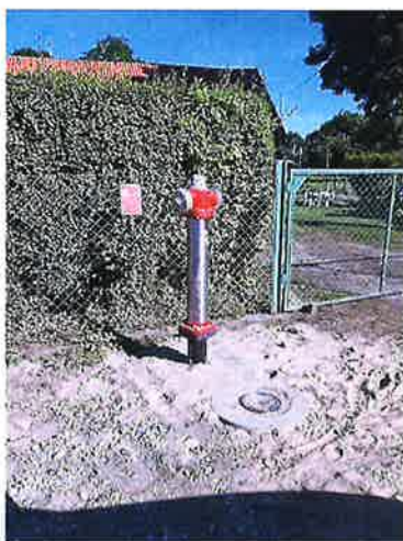
Hydrant przed i po wymianie.