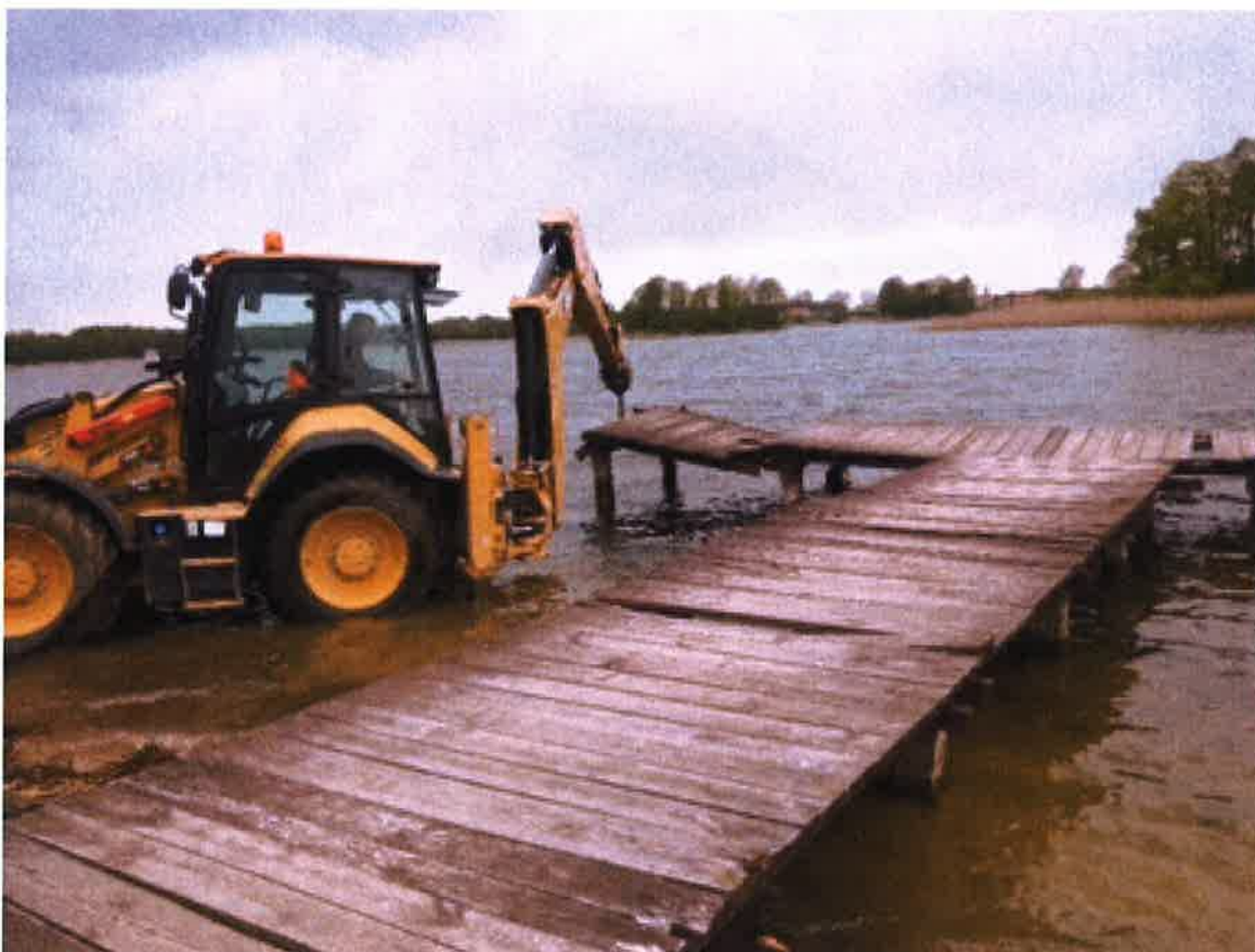
Modernizacja pomostu przy OSP Szeligi.