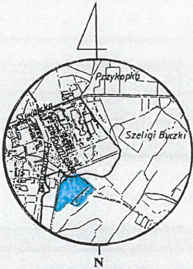
SZKIC ORIENTACYJNY SKALA 1 : 50 000

Dostęp do drogi publicznej nowo wydzielonych działek poprzez nowo powstałą drogę wewnętrzną - działkę nr 10/11.