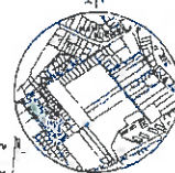
KOPIA FRAGMENTU RYSUNKU „STUDIUM” GM. ELK SKALA 1 : 25000

MAPA SYTUACYJNO WYSOKOŚCIOWA rysunek planu skala 1 : 1000 1 cm = 10 m