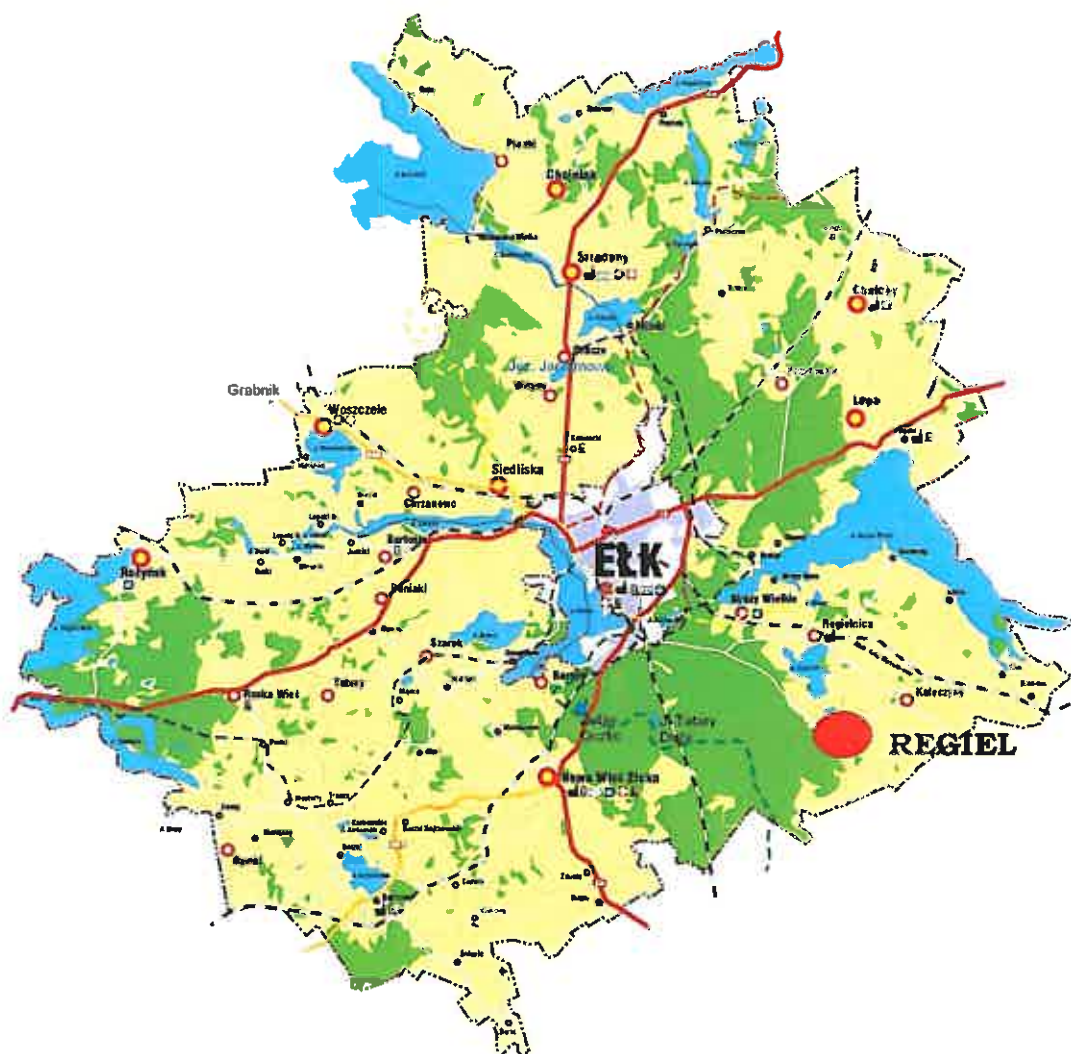
Rys 1. Mapa Gminy Elk

zaplanowanych celów i priorytetów rozwojowych, w okresie najbliższych siedmiu lat, które obejmuje Plan Odnowy Miejscowości Regiel podejmowane będą zarówno działania inwestycyjne, a także inne o charakterze szkoleniowym czy rekreacyjno-sportowym.