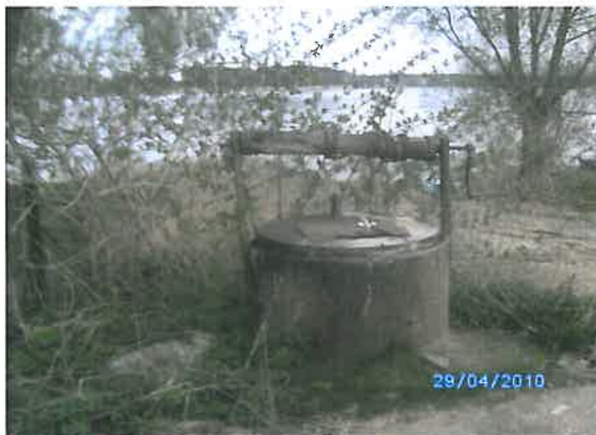
Rys. 8 Studnia znajdująca się w miejscowości Szeligi – Buczki

Powyższa studnia cieszy się dużym zainteresowaniem wśród mieszkańców oraz turystów. Z jej źródła można napić się czystej i smacznej wody. Turyści często nabierają wodę w butelki i zabierają do swoich rodzinnych miast.