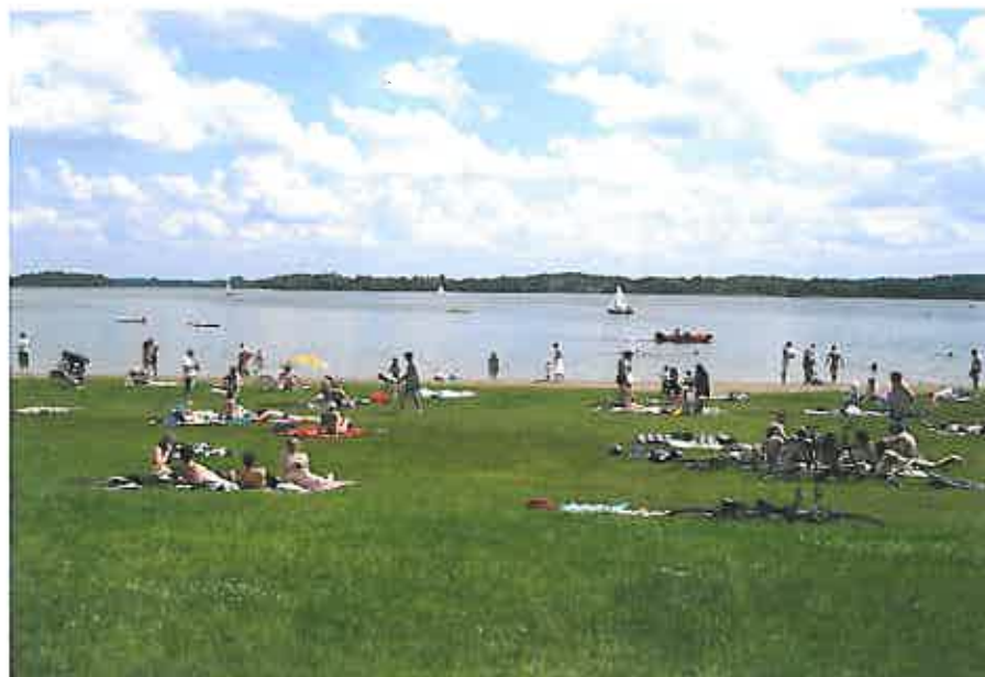
Rys. 7 Plaża w obrębie Szeligi - Buczki

Kąpielisko Jeziora Selment Wielki w obrębie Szeligi - Buczki jest objęte corocznym nadzorem Inspekcji sanitarnej. W 2009 roku w sezonie letnim powyższa instytucja badała jakość wody. Badania wskazały, iż woda nadaje się do kąpieli i mieści się w I klasie czystości.