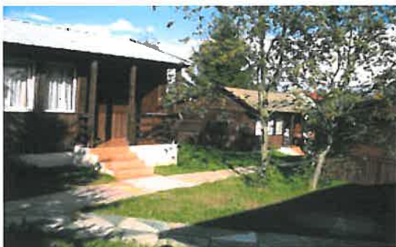
Rys. 11 Domki letniskowe położone niedaleko plaży Szeligi – Buczki

W samym centrum wsi znajduje się duża plaża ciesząca się zainteresowaniem zwłaszcza w sezonie letnim. Mieszkańcy ościennych miasteczek często przyjeżdżają tu skorzystać nie tylko z uroków słońca, pięknego jeziora ale również pograć w piłkę siatkową czy też nożną. Niedaleko plaży znajdują się domki letniskowe.