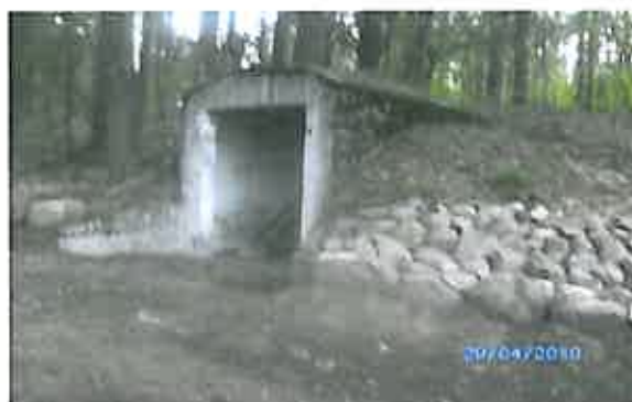
Rys. 4 Bunkier znajdujący się na terenie Szeligi – Buczki