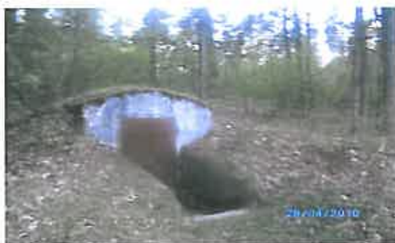
Rys. 3 Bunkier znajdujący się na terenie Szeligi – Buczki

W obrębie Szeligi – Buczki znajdują się również bunkry, które powstały po II wojnie światowej.