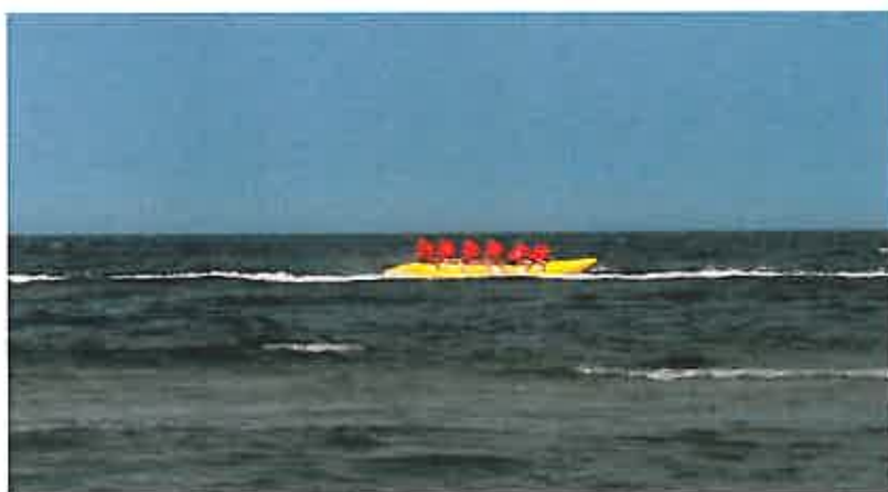
Rys. 13 Sporty wodne (jazda na bananie)

Poprawa jakości oraz rozbudowa infrastruktury sportowej wewnątrz miejscowości przyczyni się do promocji prosportowych nawyków wśród mieszkańców wsi. Możliwość czynnego uprawiania sportu, na poziomie amatorskim, wpłynie aktywizująco na lokalną społeczność przyczyniając się jednocześnie do poprawy stanu zdrowia mieszkańców.