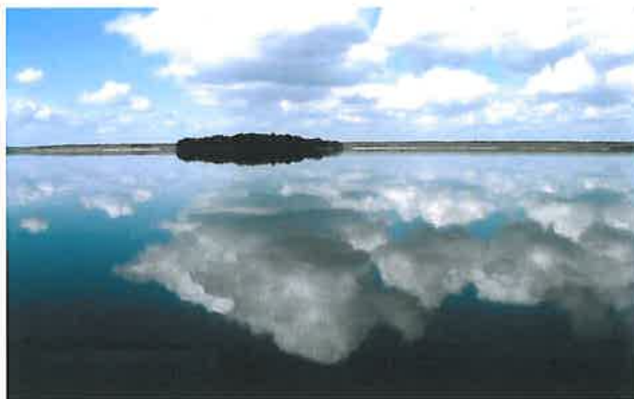
Rys. 6 Jezioro Selment Wielki

Kąpielisko Jeziora Selment Wielki w obrębie Szeligi - Buczki jest objęte corocznym nadzorem Inspekcji sanitarnej. W 2009 roku w sezonie letnim powyższa instytucja badała jakość wody. Badania wskazały, iż woda nadaje się do kąpieli i mieści się w I klasie czystości.