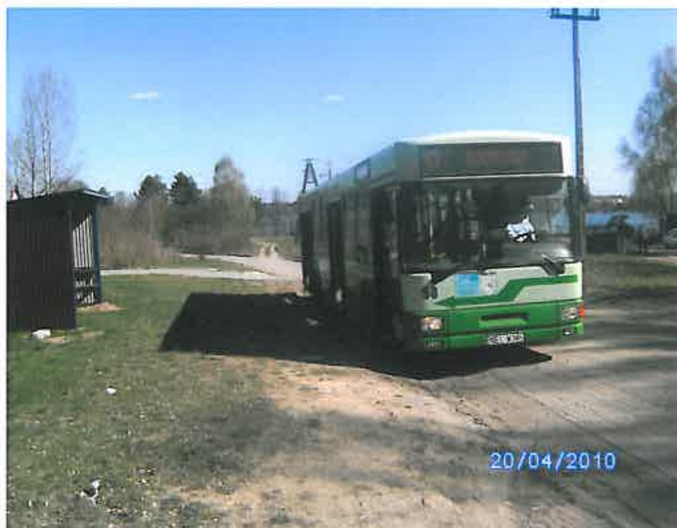
Rys. 5 Komunikacja Szeligi - Buczki

Wieś Szeligi - Buczki jest dużą wsią letniskową. Można tu dotrzeć autobusami MZK.