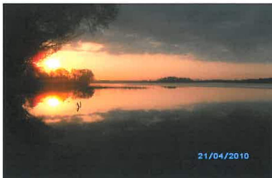
Rys. 9 Jezioro Selmęt Wielki

Powyższa studnia cieszy się dużym zainteresowaniem wśród mieszkańców oraz turystów. Z jej źródła można napić się czystej i smacznej wody. Turyści często nabierają wodę w butelki i zabierają do swoich rodzinnych miast.