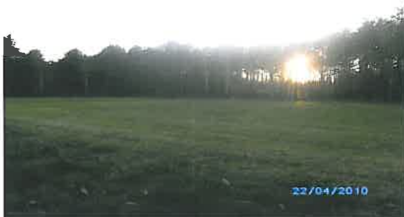
Rys. 12 Boisko znajdujące się w miejscowości Szeligi - Buczki

korzysta z boiska znajdującego się około 500 m od plaży. W Gminie Ełk funkcjonuje klub, zrzeszenie Ludowe Zespoły, który ma za cel statutowy szerzenie kultury fizycznej.