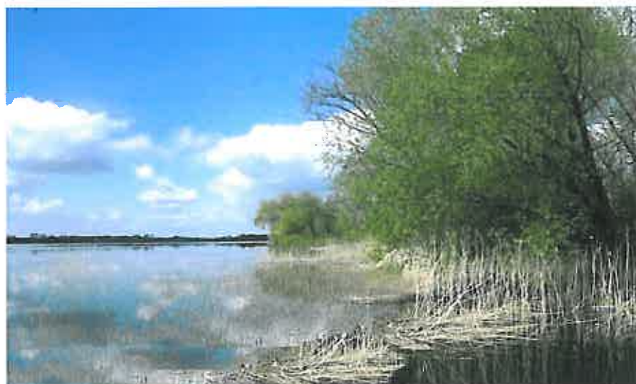
Rys. 14 Jezioro Selmęt Wielki