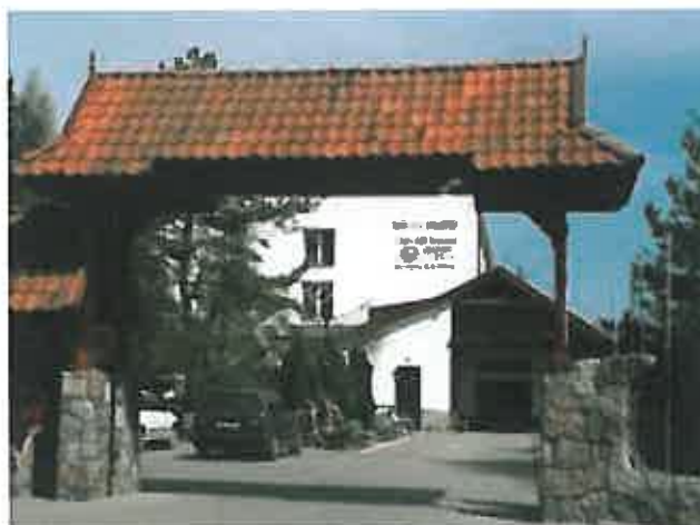
Rys. 17 Hotel Gryfia