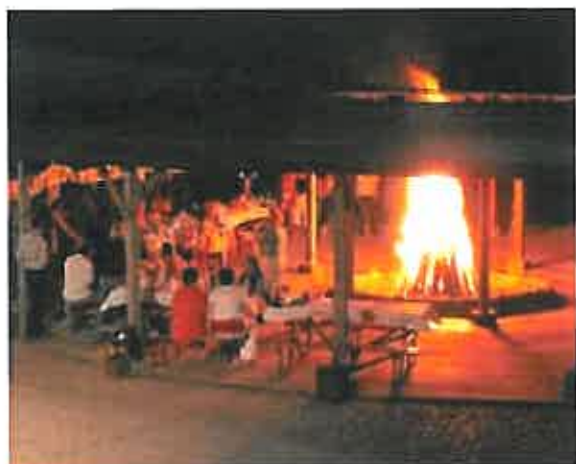
Rys. 16 Atrakcje hotelu „Selment”

Należy wspierać mechanizmy promujące przedsiębiorczość wśród mieszkańców.