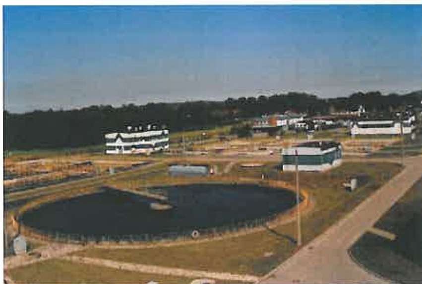
Rys. 18 Widok Oczyszczalni ścieków w Nowej Wsi Ełckiej.

Niezawodność funkcjonowania urządzeń osiągnięto poprzez wprowadzenie pełnego układu automatyki, sterowania i dozoru komputerowego. Podstawową ideą takiego systemu jest ciągła optymalizacja, współdziałanie poszczególnych procesów i podwyższanie ich sprawności. Wszystkie poczynania, zabiegi i wysoki standard zastosowanej technologii w Oczyszczalni ścieków miasta Ełku spowodowały, że dziś cała okolica wpisuje się jako element unikatowego przyrodniczo terenu zlewni rzeki Biebrzy i Narwi. Ścieki oczyszczane są w pierwszym stopniu oczyszczania w wyniku procesów mechaniczno-biologicznych na drodze naturalnej z możliwością wspomaganie chemicznego. Wysokosprawny układ technologiczny pozwala na uzyskanie w procesie biologicznym wysokiej redukcji związków biogennych: azotu i fosforu.