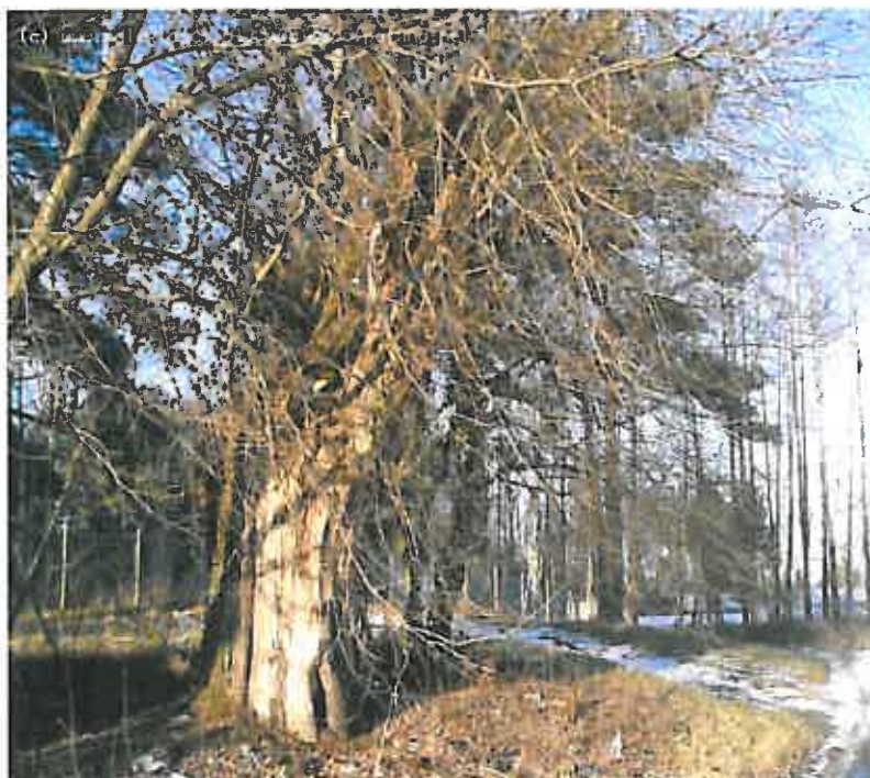
Rys. 15 Wierzba znajdująca się w obrębie Szeligi - Buczki