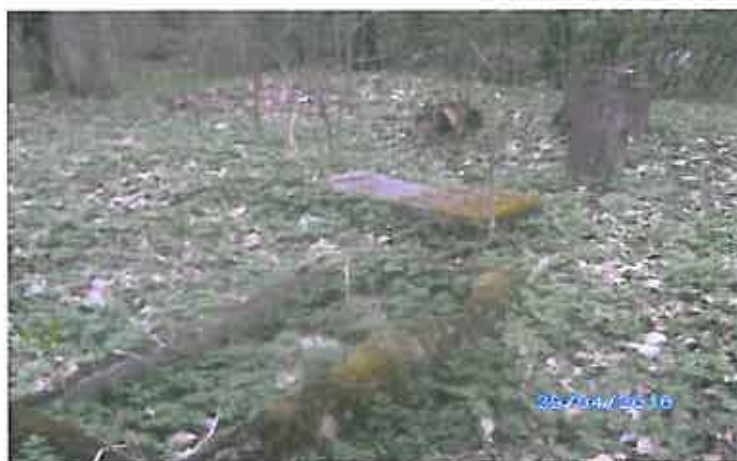
Rys. 2 Zabytkowy cmentarz ewangelicki w obrębie Szeligi – Buczki

mazurskiego pod nr A-3167 decyzją z dnia 27 czerwca 1991 roku nr WKZ 534/812/D/91. Cmentarz ewangelicki pochodzi z czasów pierwszej wojny światowej, znajdują się tam nagrobki poległych żołnierzy niemieckich z 1914 roku. Położony jest nad jeziorem Selmęt Wielki w odległości 500 m na południowy – zachód od zabudowań wsi Szeligi.