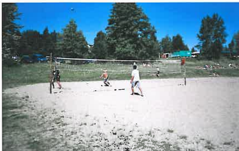
Rys. 10 Plaża w obrębie Szeligi – Buczki

W samym centrum wsi znajduje się duża plaża ciesząca się zainteresowaniem zwłaszcza w sezonie letnim. Mieszkańcy ościennych miasteczek często przyjeżdżają tu skorzystać nie tylko z uroków słońca, pięknego jeziora ale również pograć w piłkę siatkową czy też nożną. Niedaleko plaży znajdują się domki letniskowe.