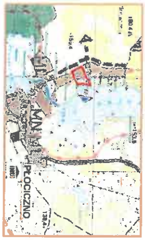
GRANICE TERENU OBJĘTEGO PLANEM

WNYS ZE STUDIUM UWARUNKOWAŃ I KIERUNKÓW ZAGOSPODAROWANIA PRZESTRZENNEGO GMINY ELK, UCHWAŁONEGO UCHWAŁĄ NR XXVII/277/2001 RADY GMINY ELK Z DNIA 30.11.2001 R. Z POZNA. ZN. SERIA 1:25000