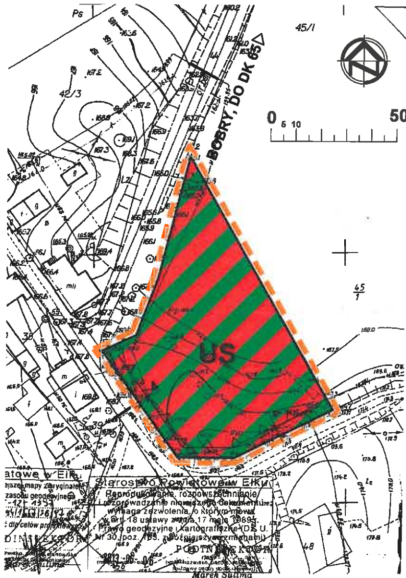
WYRYS ZE STUDIUM UWARUNKOWAŃ I KIERUNKÓW ZAGOSPODAROWANIA PRZESTRZENNEGO GMINY EŁK skala 1:25 000

ZAŁĄCZNIK NR 1 do Uchwały Nr ...../..... Rady Gminy Ełk z dn. .... r.