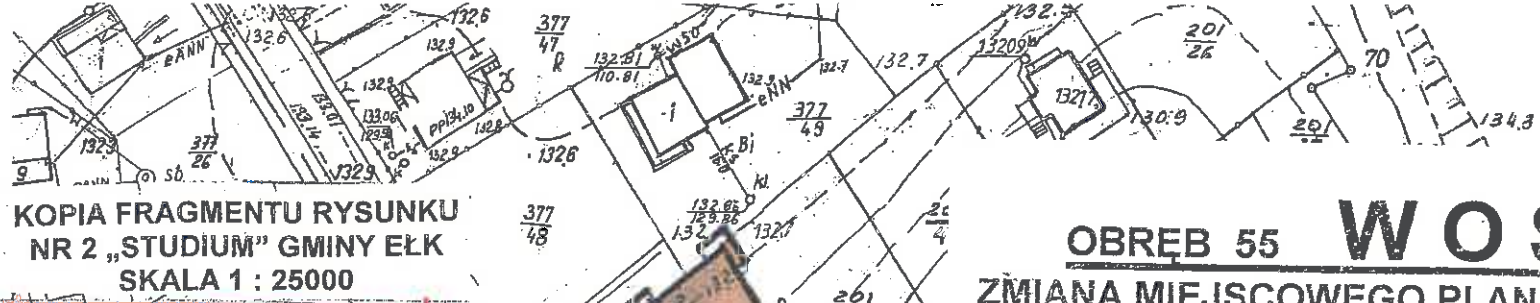
KOPIA FRAGMENTU RYSUNKU NR 2 „STUDIUM” GMINY ELK SKALA 1 : 25000

STAROSTWO POWIATOWE WEŁKU 19-300 ELK, ul. Piłsudskiego 4 tel. centr. 87 621 83 00 NIP 48-15-70-636