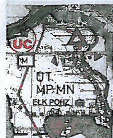
kserokopia fragmentu rysunku Studium Gminy Elk skala 1 : 25000