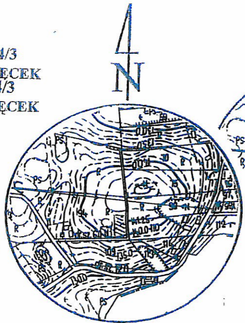
SZKIC ORIENTACYJNY skala 1:10 000

PRZEWODNICZĄCY RADY GMINY Mikołaj Swiderski