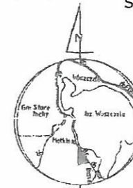
SZKIC ORIENTACYJNY Skala 1 : 50 000