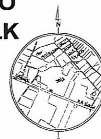
SZKIC ORIENTACYJNY Skala 1 : 50 000

Woj. Warmińsko-Mazurskie Powiat: Elcki Gmina: Elk Obręb: Małczewo działka nr 38/2.