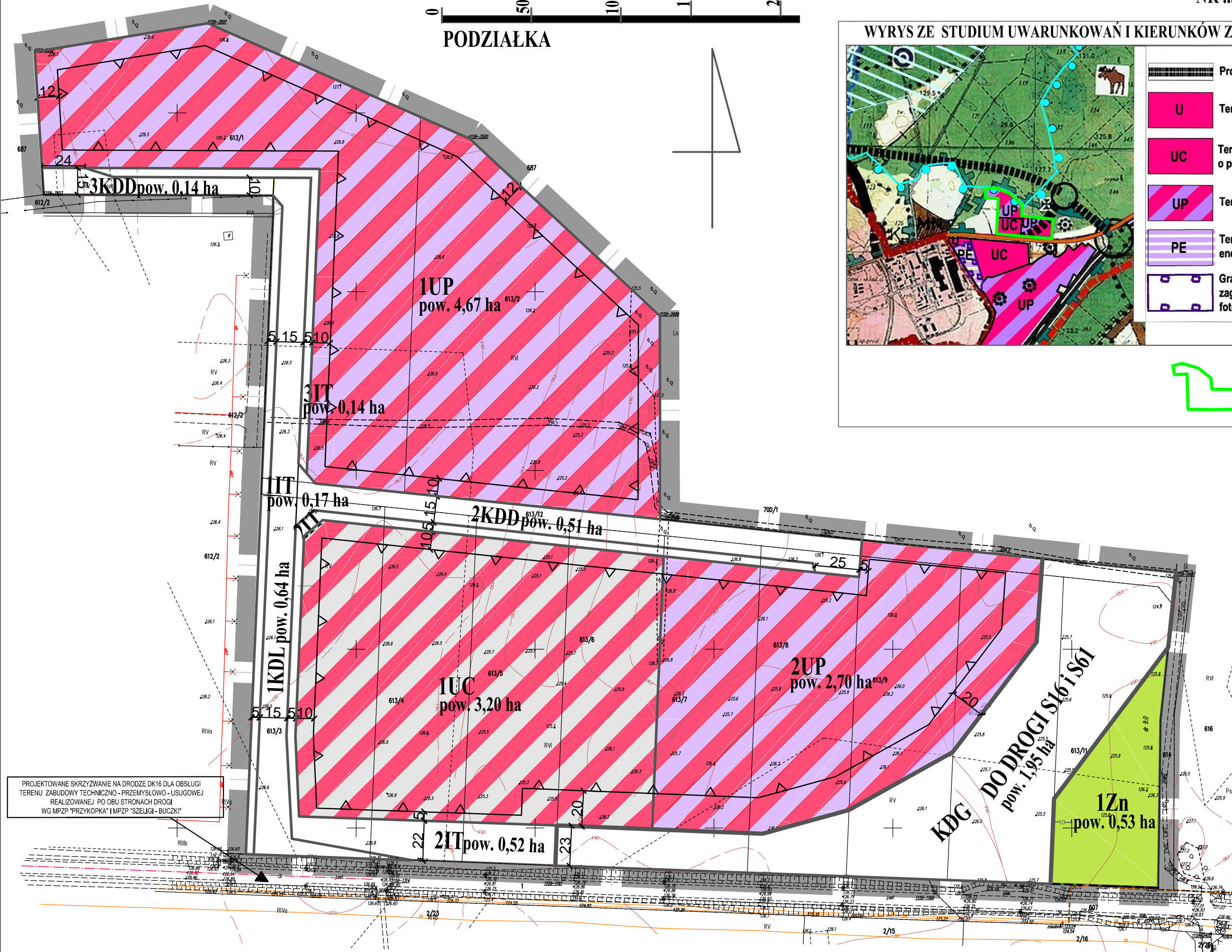
WYRYS ZE STUDIUM UWARUNKOWAŃ I KIERUNKÓW ZAGOSPODAROWANIA PRZESTRZENNEGO GM. EŁK