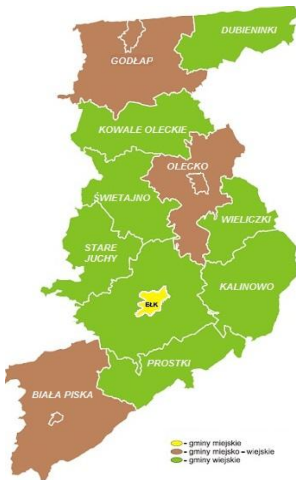
Rysunek 1. Mapa Gmina należących do Związku.