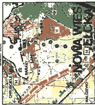
WYRSZĘ STUDIUM UMIAKNIOWAŃ I MERANKÓW ZAGOSPODAROWANIA PRZESTRZENNEGO GMINY ELK

LEGENDA RYSUNKU STUDIUM: GRANICE TERENU OBJĘTEGO MIEJSCOWYM PLANEM ZAGOSPODAROWANIA PRZESTRZENNEGO