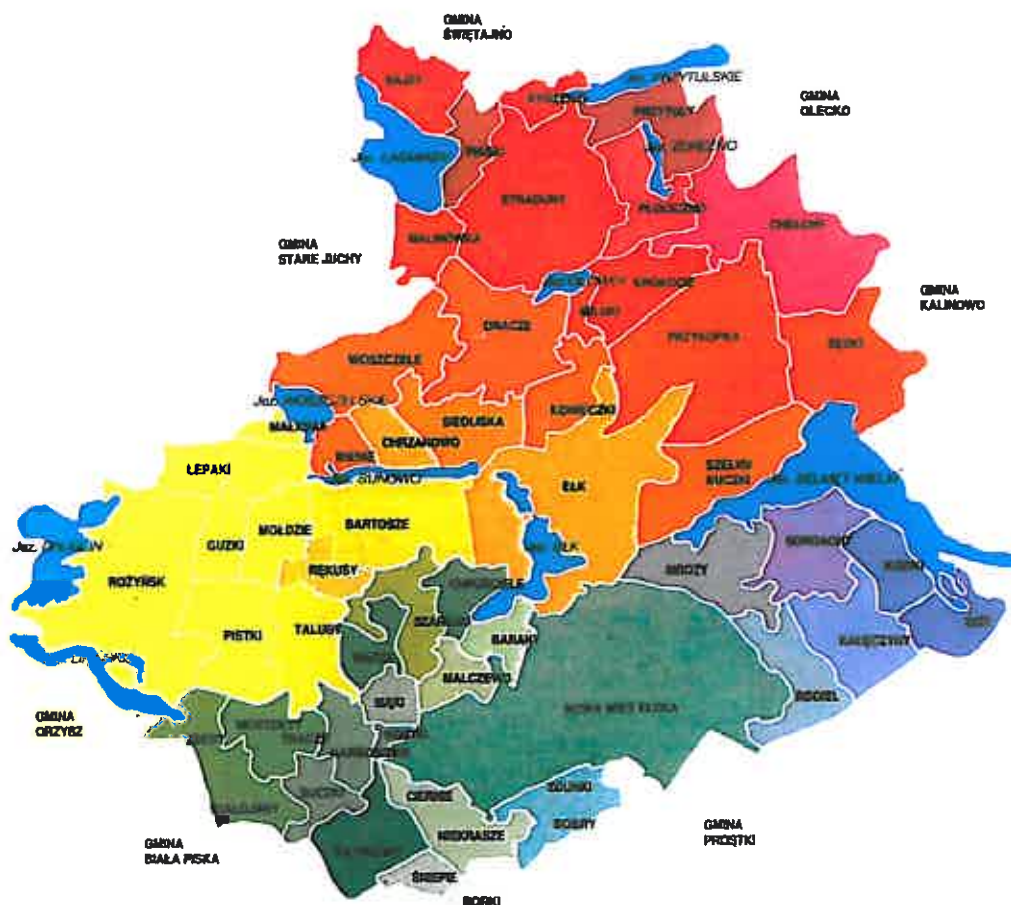
Rys. 6 Mapa Gminy Ełk z wyszczególnieniem miejscowości

Miejscowości najbliżej położone Chełch i Czapli są: Przykópka (3,5 km), Sędki (5 km), Olecko (41,5 km), Ełk (10,3 km).