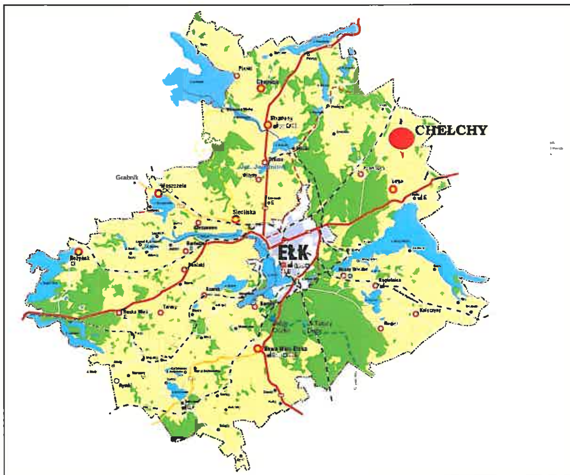
Rys 1. Mapa Gminy Elk