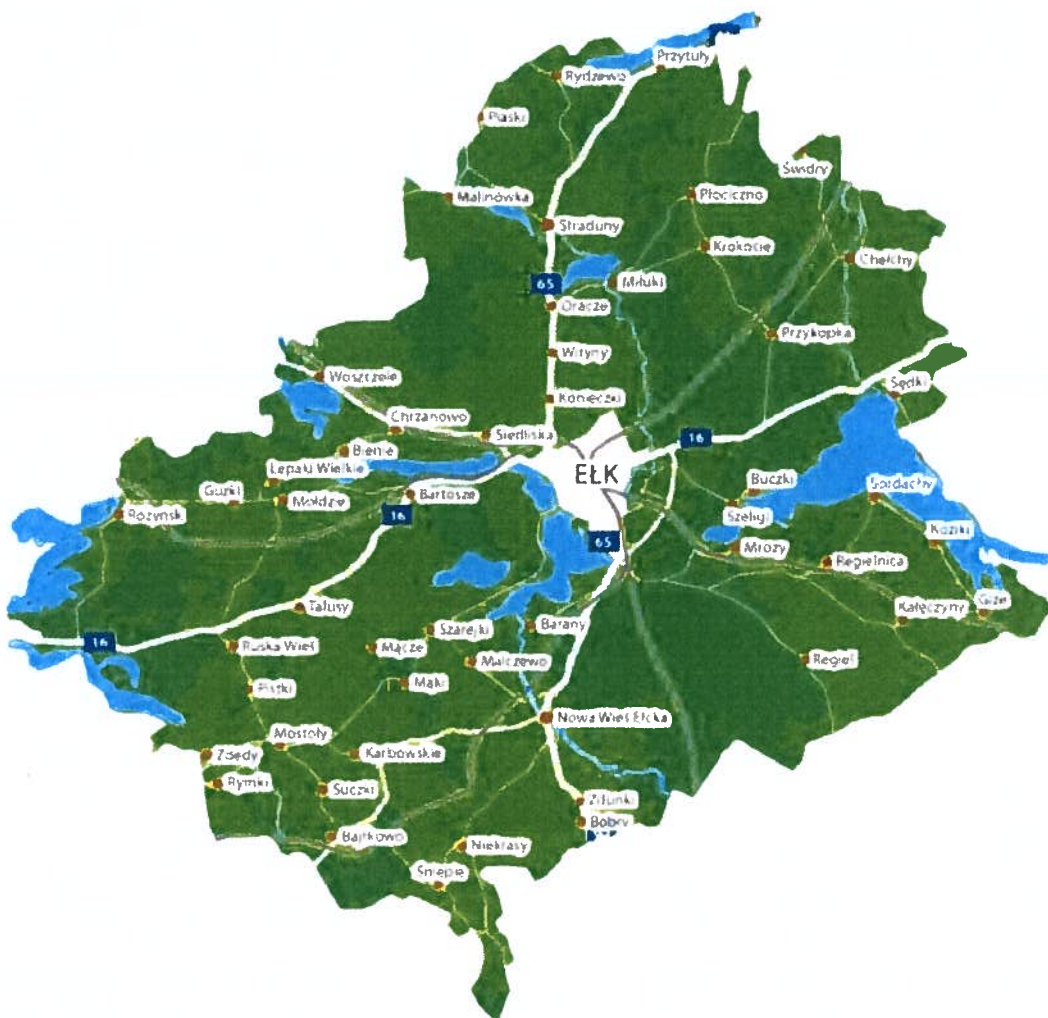
Rysunek 2. Mapa sołectw w Gminie Ełk.

Programu ochrony środowiska na lata 2014 – 2017 z perspektywą na lata 2018 – 2021 dla gminy Ełk Buczki, Oracze. Na skraju gminy położone są Przytuły, Sajzy, Malinówka, Woszczele, Rożyńsk, Bajtkowo, Gize, Sędko i Chełchy.