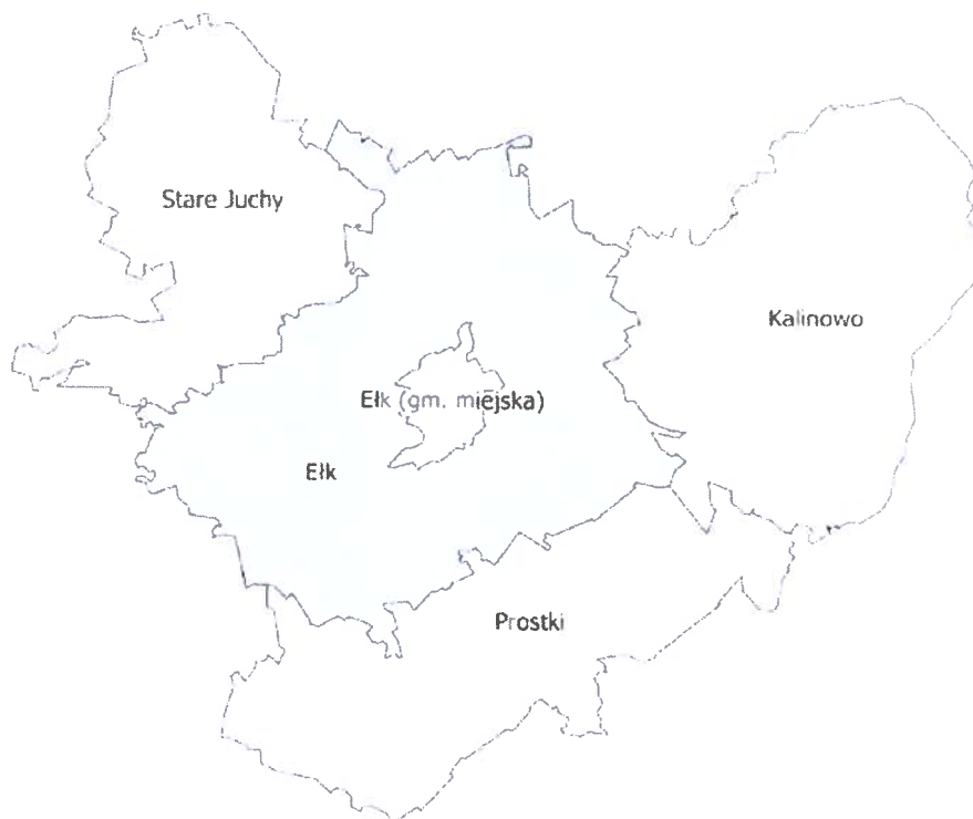
Rysunek 1. Położenie gminy wiejskiej Ełk na terenie powiatu ełckiego.

Gmina Ełk położona jest w północnej części Polski, w południowowschodniej części województwa warmińsko – mazurskiego. Administracyjnie gmina Ełk jest gminą wiejską zlokalizowaną w centralnej części powiatu ełckiego i jedną z 5 gmin tego powiatu. Miasto Ełk jest położone w centralnej części obszaru gminy Ełk. Analizowana gmina graniczy z następującymi gminami: Stare Juchy, Świętajno, Olecko, Kalinowo, Prostki, Biała Piska i Orzysz.