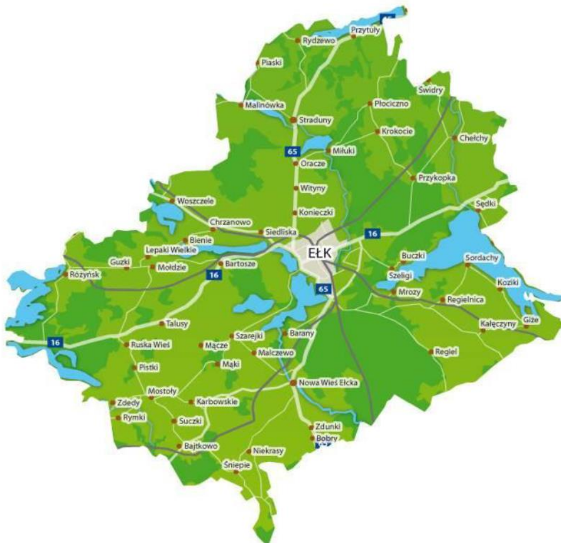
Rysunek 2. Mapa sołectw w Gminie Ełk.

Programu ochrony środowiska na lata 2014 – 2017 z perspektywą na lata 2018 – 2021 dla gminy Ełk Buczki, Oracze. Na skraju gminy położone są Przytuły, Sajzy, Malinówka, Woszczele, Rożyńsk, Bajtkowo, Gize, Sędki i Chelchy.